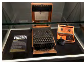
フィンランド Museo Militaria(軍事博物館)で浅野が撮影

ひと文字タイプするごとに、歯車が動いて、暗号化のキーがどんどん変わっていく 当時最強の暗号機